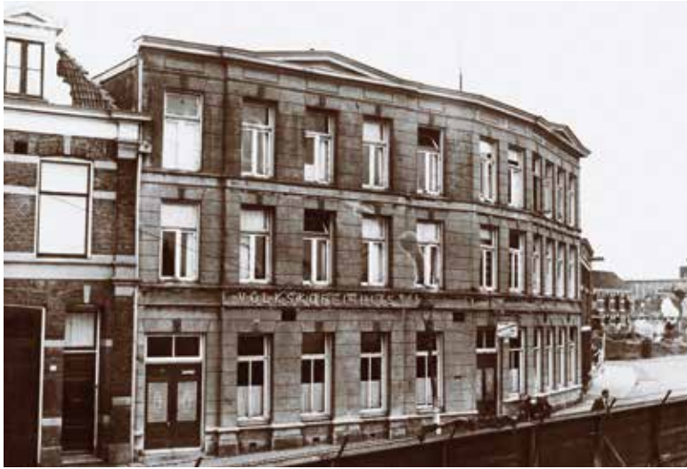
Op 7 januari 1899 ging het Volkskoffiehuys open.

of thee, een glas melk, kwast of limonade. Het moest geen café worden, waar je in de gelagkamer de zwoele dampen van bier en jenever opsnoof, maar de pittige geur van vers gezette koffie. 30