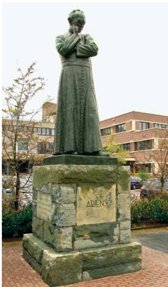
Peinzend kijkt Alphons Ariëns uit over het plein dat naar hem werd genoemd, tegenover de HTS.

In Enschede staat een imposant kunstwerk, een